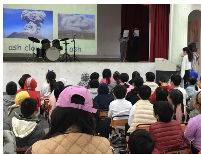
六年級小主題：火山構造