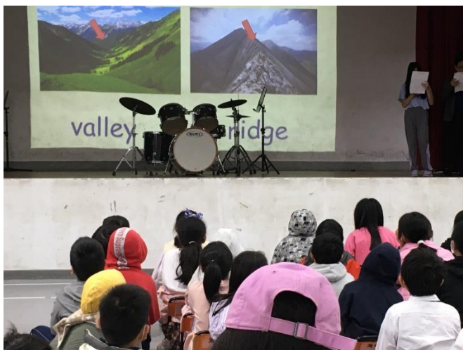
五年級小主題：山脈構造