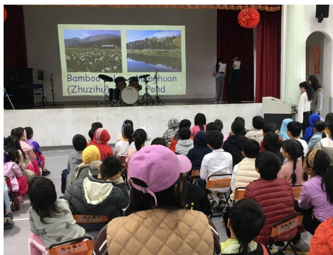
四年級小主題：自然景點