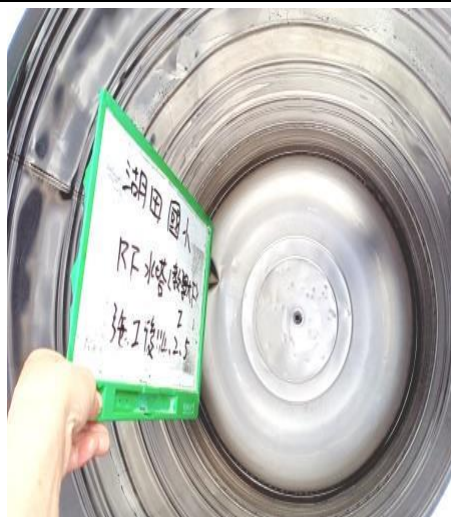
教學大樓水塔-2 施工後