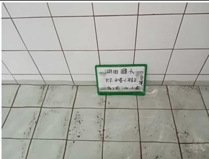
司令台 1F 總蓄水池 施工前