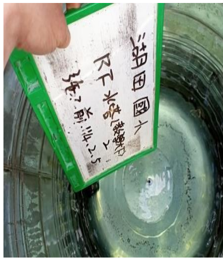
教學大樓水塔-2 施工前