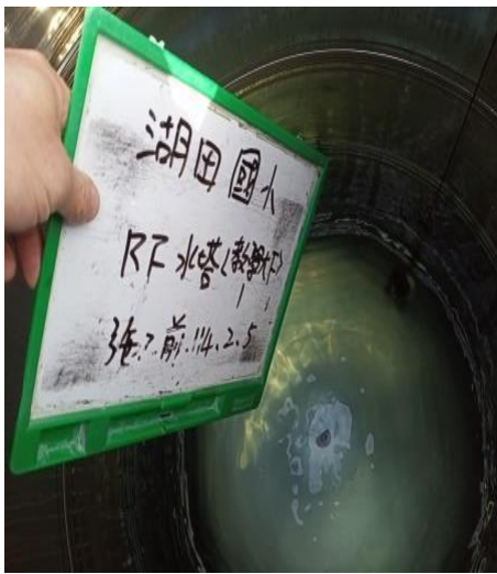
教學大樓水塔-1 施工前