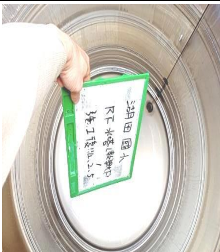
教學大樓水塔-1 施工後