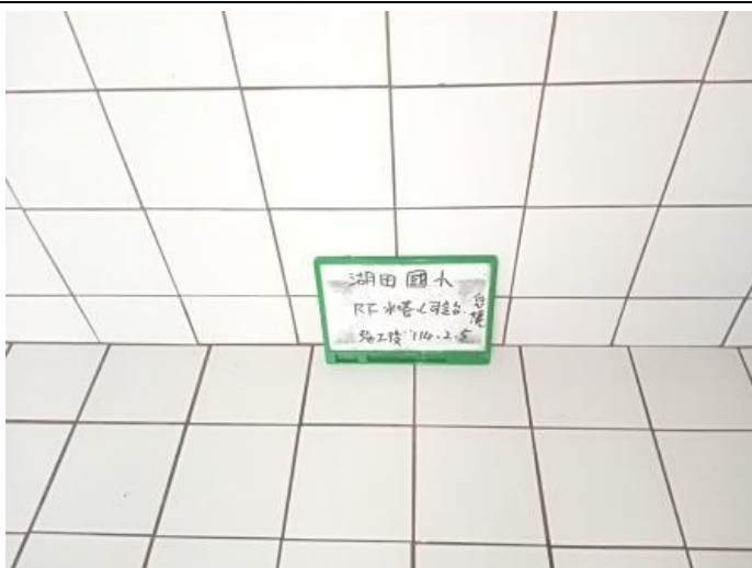
司令台 1F 總蓄水池 施工後