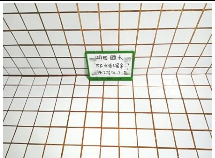
宿舍頂樓水塔 施工後