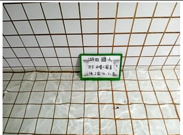
宿舍頂樓水塔 施工前